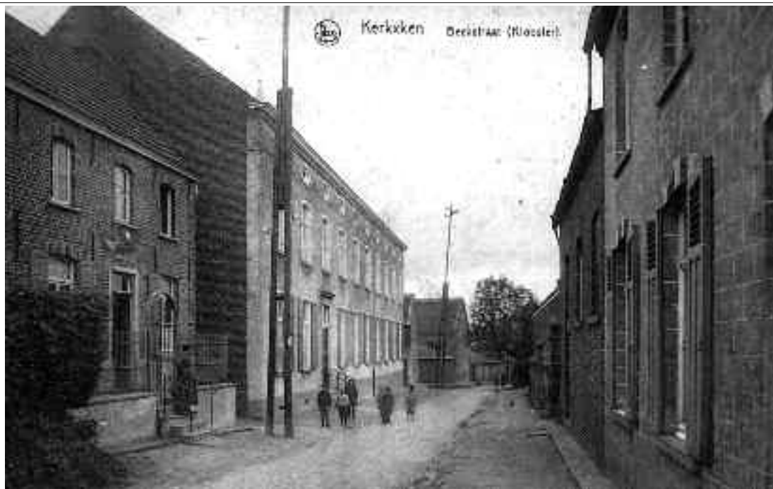
Klooster, kantschool Beekstraat Kerksken ingehuldigd in 1865