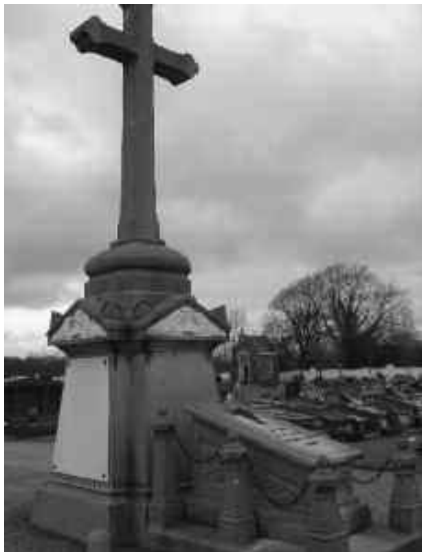
Grafmonument op het kerkhof te Aalst