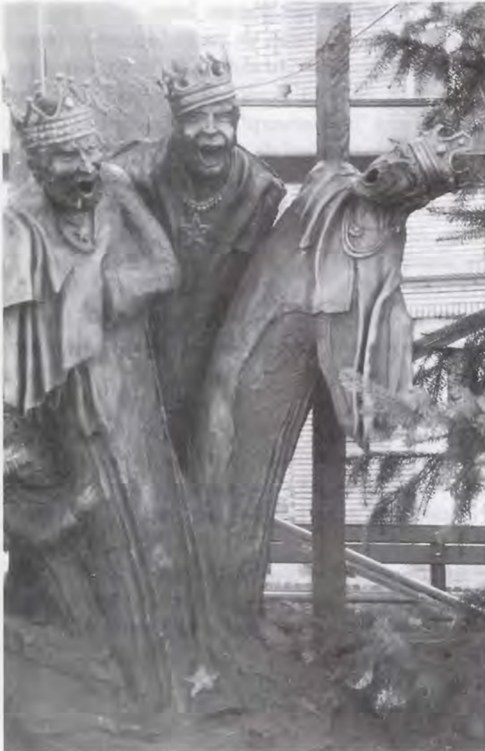
Driekoningenbeeld - Denderhoutem

Twee van de Haaltertse deelgemeenten Denderhoutem en Kerksken dingen elkaar naar de kroon bij viering van het Driekoningenfeest.