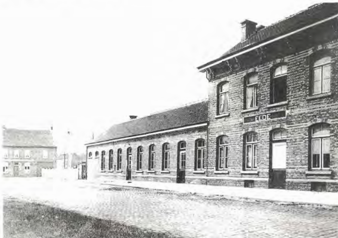
Station Eede (± 1910)

"Op het dringend verzoek van den heer De Sadeleer heeft de heer Helleputte eenen hoogen ambtenaar naar de Halte Eede gezonden, om er een onderzoek ter plaats te doen. Daaruit is gebleken dat de instellingen der halte zeer onvoldoende zijn voor de talrijke reizigers die er dagelijks den trein nemen of er afstappen. Ten gevolge van dit onderzoek zal er onmiddellijk een nieuwe in- en uitgang gemaakt worden. Ook is men volop bezig aan het plan eener nieuwe statie."