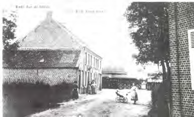
Omgeving van de halt - links herberg «By Tamboer»