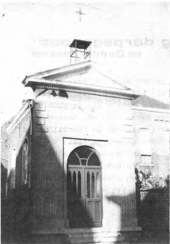
De kapel rond de jaren 1950. Bemerk het nog ongewijzigd fronton