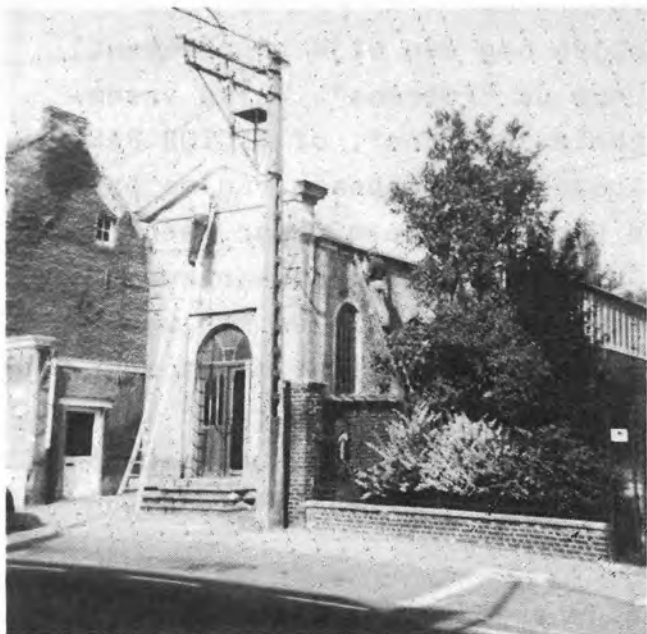
Herstellingen uitgevoerd door gemeentewerklieden