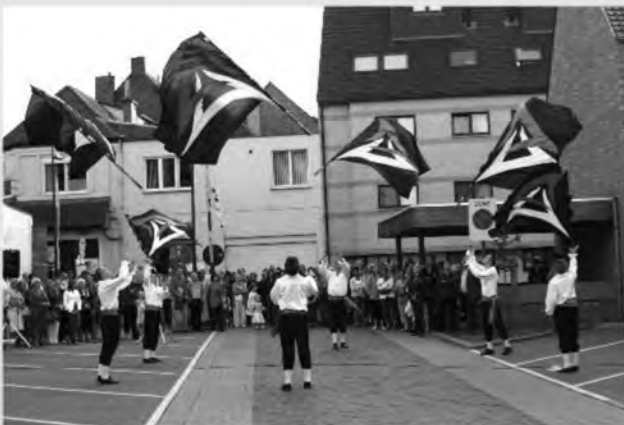
Vlagkunst Flago zorgde voor een sfeervolle omkadering.